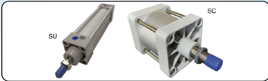
Código (Kit SU e SC)